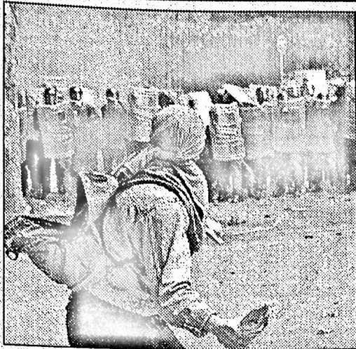
Un manifestante dei gruppi più violenti lancia una bottiglia molotov contro lo schieramento della polizia