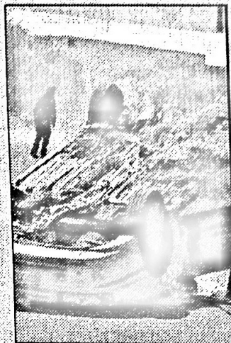
In alcune zone della città i gruppi anarchici hanno dato alle fiamme auto e negozi